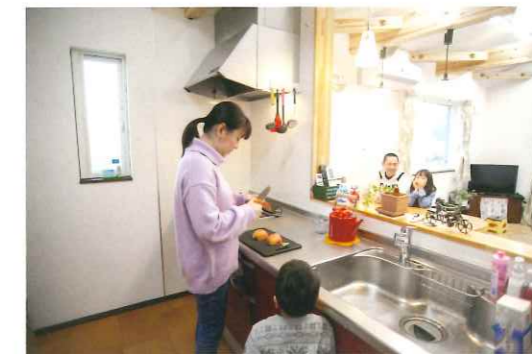
会話がはずむ対面キッチン。 毎日の家事も楽しい時間に。