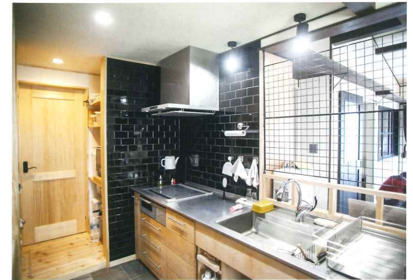
奥様こだわりのオーダーキッチン。 使いやすいようにと打合せを重ねました。

最後にこの家づくり携わっていただいた方々、そして家族に心からお礼を言いたいです。本当にありがとうございました。