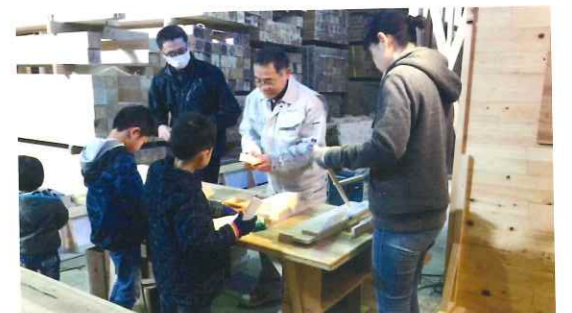
大人気！ものづくりの体験ができる「Itsubo Craft Factory」

さしがねとメジャー いつも仕事で使っているものですが、大活躍している相棒たちです！