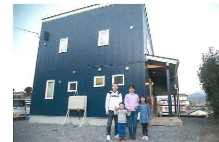
家族皆で記念写真。これからもたくさん の思い出を作ってください。