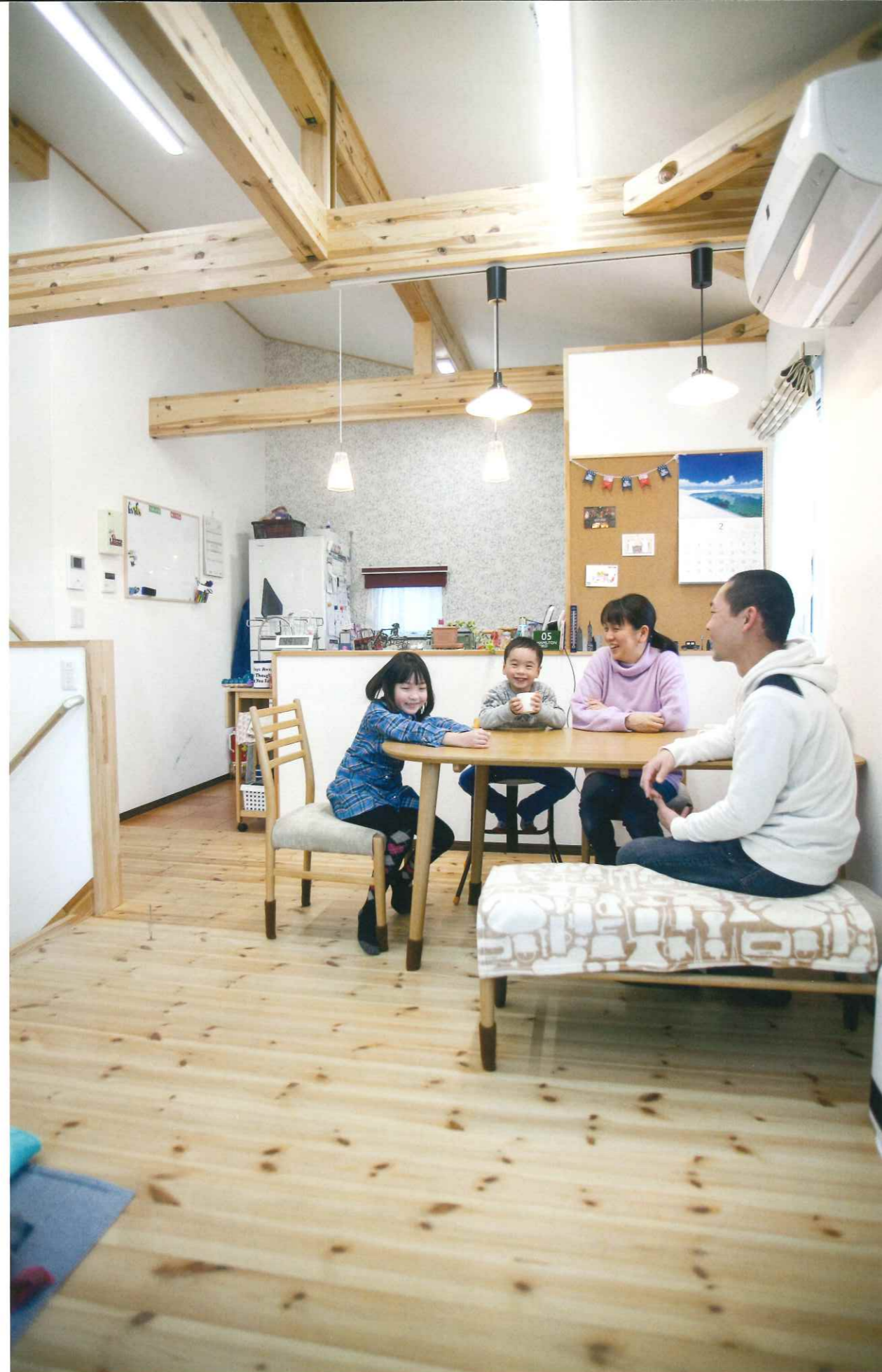
家族が一番集まるダイニングスペース。 家族のふれあいの場。