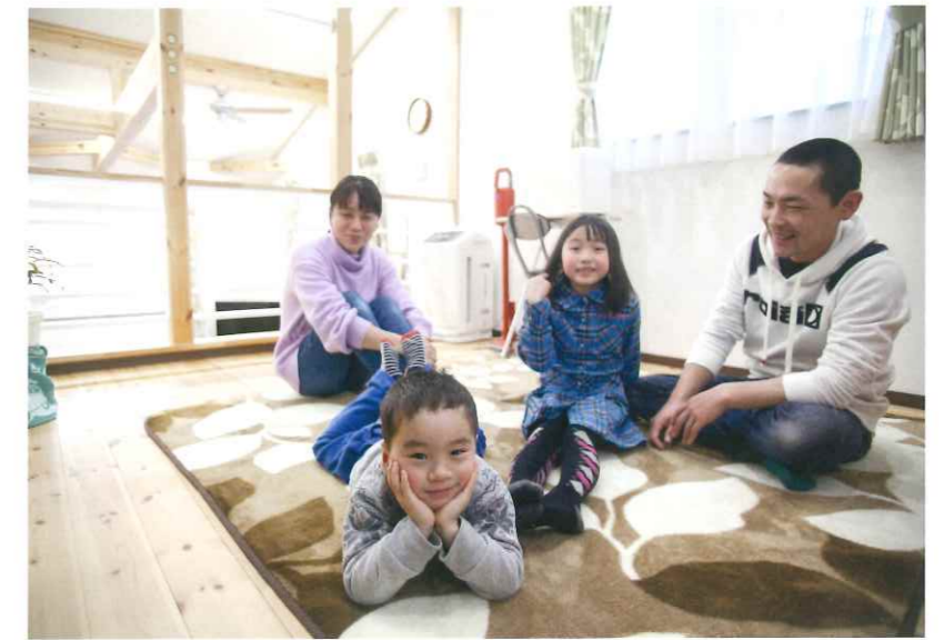
セカンドリビングで家族団らんのひととき。

以前のアパートは古く、隣の住人の方にも気がつかって生活をしていましたが、今はとても快適に暮らしています。冬を越してみても、暖房費もあまり使わない生活ができているのでとてもありがたいです。これからもメンテナンスなどでお世話になるとは思いますが、よろしくお願いします。