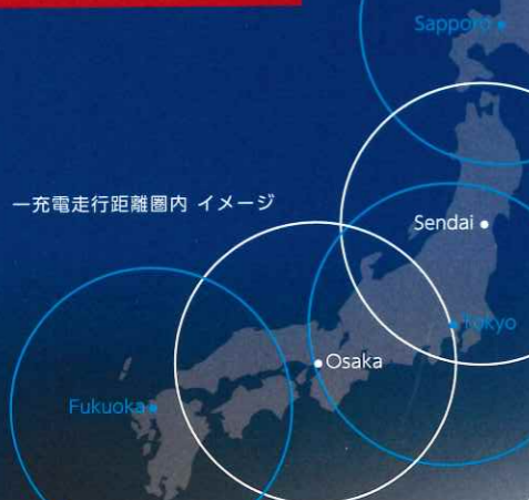
一充電走行距離圏内 イメージ