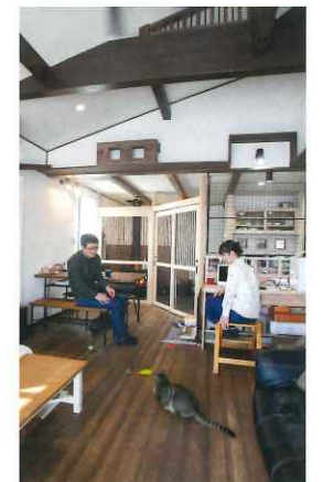
猫ちゃんが遊べるようにキャットウォーク を施工。リフォームでありながらも自由な空間に。