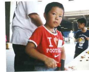
なべた 那由大くん 気分は大工さん？！