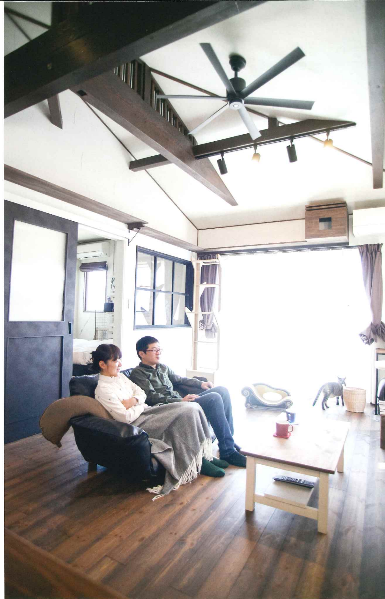
家族の憩いの場でもある リビングコーナー。