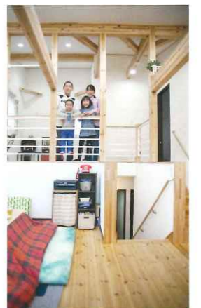
今はフリースペースとしてのセカンド リビングお子様の遊び場や家事ス ペースとして大活躍。