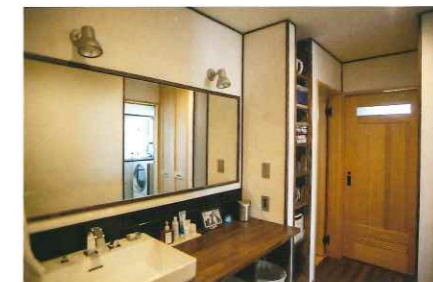
洗面カウンターは広々とし、収納もあって 使いやすい。