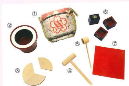
①本体1つ ②朱桶1つ ③鏡板(ミニ鏡開きセット専用)1つ ④ミニ小櫃1本 ⑤ミニ木杓1本 ⑥3.3勺塗升3つ ⑦毛氈(ウール100%)1枚

春は、入卒業式や入社 結婚などおめでたい行事が続く季節。ぜひ、江戸時代から続くこのおめでたい習わしを、ご家庭で再現してみたいかがたうか。