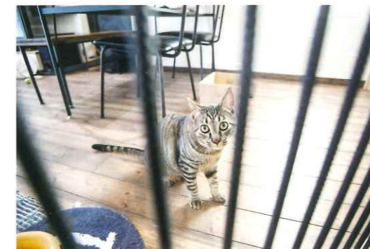
家族同然の猫ちゃんものびのびと過ごせて います。